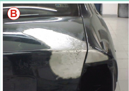
Trabalho feito utilizando a Repuxadora Elétrica (Spotter)