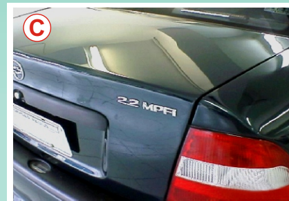
Depois: Peça recuperada e pintada.