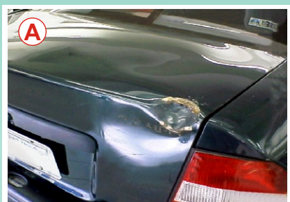
Antes: Amassado na tampa traseira com acesso quase nulo.